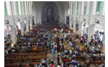
教会で避難生活を送る人々

これに対し、アジア太平洋YMCA同盟・フィリピンYMCA同盟より世界のYMCAに対し、緊急募金の呼びかけがなされました。セブYMCA (セブ島) やイロイロYMCA (パナイ島) など被災地にあるYMCAによる支援活動を支えます。