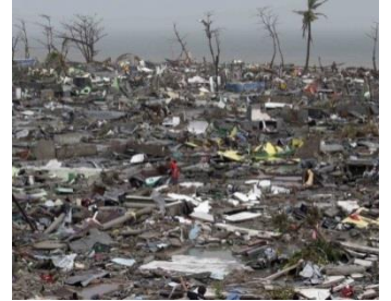
甚大な被害を受けたレイテ島 タクロバン市

11月8日、台風30号の直撃を受けたフィリピン中部のビサヤ諸島では、犠牲者が1000人超になるとみられています。特に、レイテ島の中心都市タクロバン市では、暴風雨と高潮に見舞われ、住宅が濁流にさらわれるなど、甚大な被害に遭っています。報道によると、フィリピン全体で約950万人以上が被災し、約50万人以上が避難所などに避難しています。